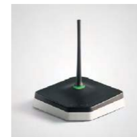
Orderman Funk: einzigartig stabil und sicher.