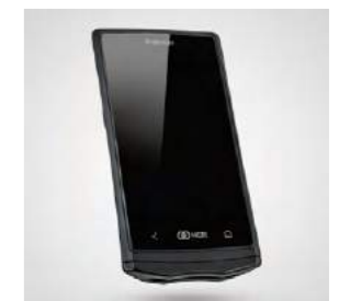
Orderman5+: Das Plus-Modell mit NFC-Leser (ideal für Zutrittssysteme) und Bluetooth zur Verwendung des Gürteldruckers.