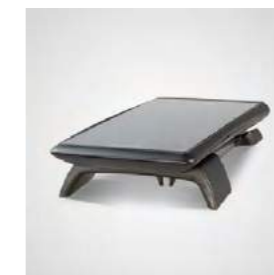
eBase zum Laden und für Software-Updates im Lieferumfang enthalten. Auch als tragbare Mini-POS verwendbar.