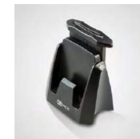
Dual-Akkulader mit Schonlade- und Schnellladefunktion.